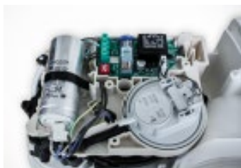
snadný přístup k motoru

Spolehlivé čerpadlo má výkonný tichý motor a mělnicí systém s lopatkami z poniklované nerezové oceli. Oproti mnoha jiným zařízením má GENIX v případě blokace motoru velmi snadnou údržbu – možnost odpojení dílčí sestavy motoru pouze s pomocí dvou šroubů. K dispozici je vypouštěcí ventil včetně odvodní hadičky, což umožňuje čistý a bezproblémový servis. Systém obsahuje integrované zpětné ventily v přívodním potrubí a u typu 130 i v bočních spodních otvorech. Jako příslušenství je možné zajistit akustický alarm proti zaplavení a trubkový adaptér pro přizpůsobení GENIX pro většinu stávajících zařízení.