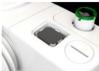
filtr proti zápachu