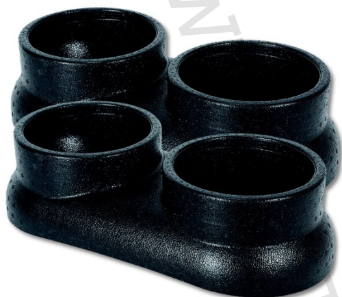
IVAR.AIR TOUCH DSI

2) Typ: IVAR.AIR TOUCH DS, IVAR.AIR TOUCH DSI