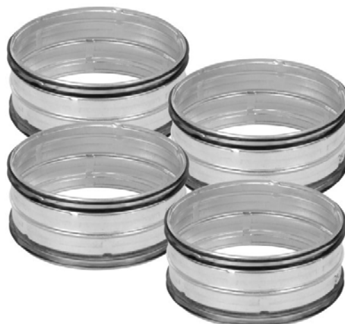
IVAR.AIR TOUCH DS