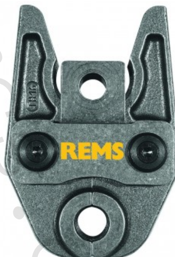
REMS lisovací čelist TH 17