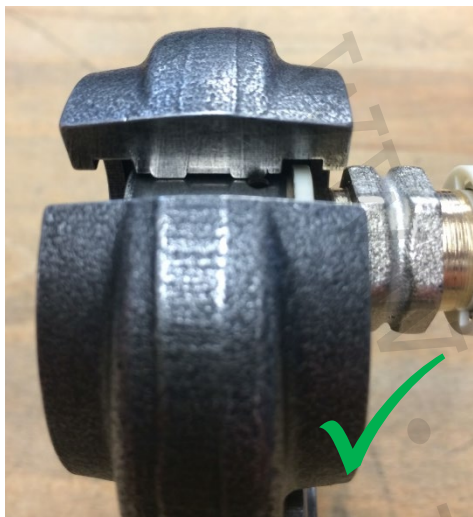
Správné usazení čelisti na lisovacím fitinku