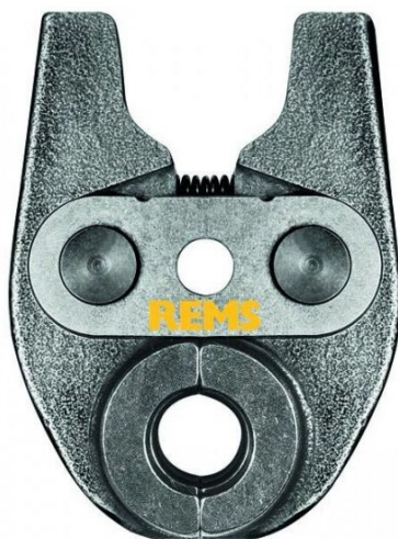
REMS lisovací čelist Mini TH 17