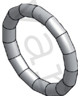
Těsnicí O-kroužek LBP