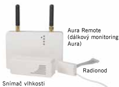
Aura Remote (dálkový monitoring Aura)

Aura Remote (dálkový monitoring Aura) pracuje na základě obousměrné komunikace, která je pohodlná a bezpečná. Sledujte své tepelné čerpadlo na dálku, okamžitě obdržíte upozornění do vašeho smartphonu, pokud dojde k jakékoli poruše. Záznamy událostí a trendové křivky vám umožňují vždy vidět, jak zařízení funguje. Princip obousměrné komunikace je založen na tom, že centrální jednotka (mobilní GSM zařízení) a Radionod (umístěný v ovládacím panelu Aura) si zasílají informace navzájem.