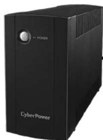
Záložní zdroj UPS, 230 V, 800 VA / 480 W