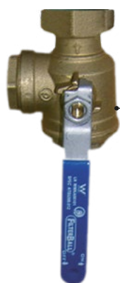
Kulový uzávěr 1" s filtrem